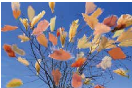
Påskviapor visar vägen